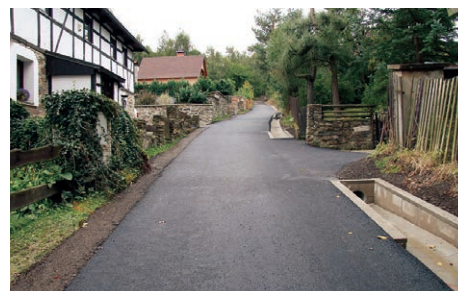
Rekonstrukce cest v Čerěníšti.