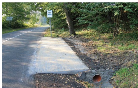
Nástupní ostrůvek v Břeži.