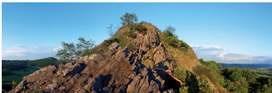
Na skalnatém vrcholu Trojhory prosperují jen velmi odolné borovice, jejichž dlouhé kořeny využívají každou puklinu ve sloupcovitě odlučné hornině.