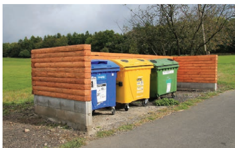
Kontejnerové stání na tříděný odpad v Němčí.