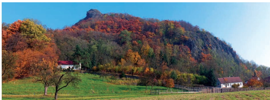
Vrch Kalich se stejnojmennou zříceninou hradu je protažen v severojižním směru.

Na hradě Lityši se kromě hradeb a příkopů dochovala také tato velice mohutná zeď hradního paláce. Je zde i zasypaná studna.