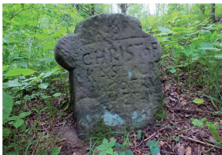
Památný kámen u Horních Chobolic.

Na Sedle však nenalezneme jen přírodní krásy. Přímo na vrchu se nachází křížový kámen (sloup) z roku 1807, k němuž poutníci přikládají kameny. Při červeně značené cestě z Jeleče k severnímu rozcestí pod Sedlem se