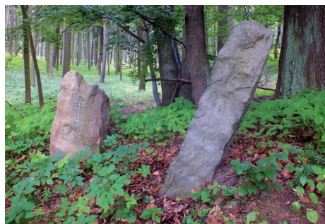
Dva smírčí (křížové) kameny pod Sedlem.

Přechod přes hřeben Sedla patří k nejmalebnějším procházkám ve Středohoří, a to především díky členité vrcholové stezce, která často vede přímo skrz průrvy mezi krásnými skalami. Určitou nevýhodou je, že ačkoli lze na Sedlo vystoupat po značených turistických cestách buď ze severu nebo z východu, v obou případech je nutné překonat značné převýšení po strmých pěšinách. Sedlo je národní přírodní rezervací – na strmých balvanitých svazích se zachovaly prastaré lesy, kde mají svá stanoviště vzácné rostliny a živočichové. Laicky se dá říci, že Sedlo je zbytkem přírodních magmatických drah několika sopek, jejichž původní vrcholy se nacházely mnoho set metrů nad současnou horou. Hornina Sedla je označována jako trachybazalt, což je jakási kombinace čediče a žnělce. Trachybazalt se na mnoha místech dělí na ohromné sloupce, které vytvářejí efektní podívanou. Obrovský blok trachybazaltu se kdysi v minulosti odlomil z jihozápadního skalnatého výchozu, a tak na úpatí hory vznikl dnes poněkud zapomenutý