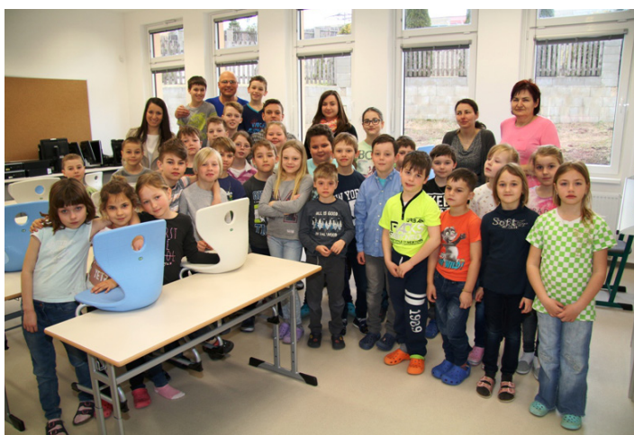
První společné foto

V legislativním rámci budova prošla kolaudačním řízením, které se uskutečnilo 2. 3. 2017 za účasti zřizovatele, zástupců školy, zhotovitele a orgánů v kolaudačním řízení. Hurá! Škola je na světě nejen fyzicky (a je krásná), ale i v souladu s přísnými dokumenty na stavbu a její vybavení, byť zatím jen v tzv. zkušebním provozu.