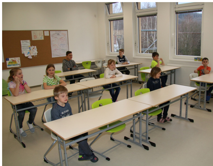
Prvňáčci si školu užijí nejdéle

Jsmo přesvědčeni, že zástupci obce a školy udělali velký kus práce, aby nová, moderní škola byla i novým, moderním, ale i radostným místem pro děti a jejich učitele. A především aby dětem zajistila ty nejlepší podmínky pro vzdělání nejen z hlediska materiálního a estetického, ale i ze strany učitelů. Všem, kdo se na vzniku školy podíleli, děkujeme!