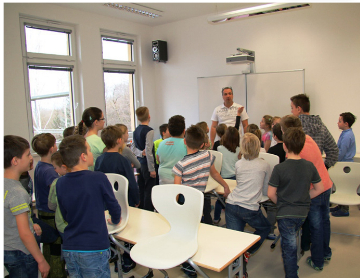
Seznamujeme se s novou školou

V legislativním rámci budova prošla kolaudačním řízením, které se uskutečnilo 2. 3. 2017 za účasti zřizovatele, zástupců školy, zhotovitele a orgánů v kolaudačním řízení. Hurá! Škola je na světě nejen fyzicky (a je krásná), ale i v souladu s přísnými dokumenty na stavbu a její vybavení, byť zatím jen v tzv. zkušebním provozu.