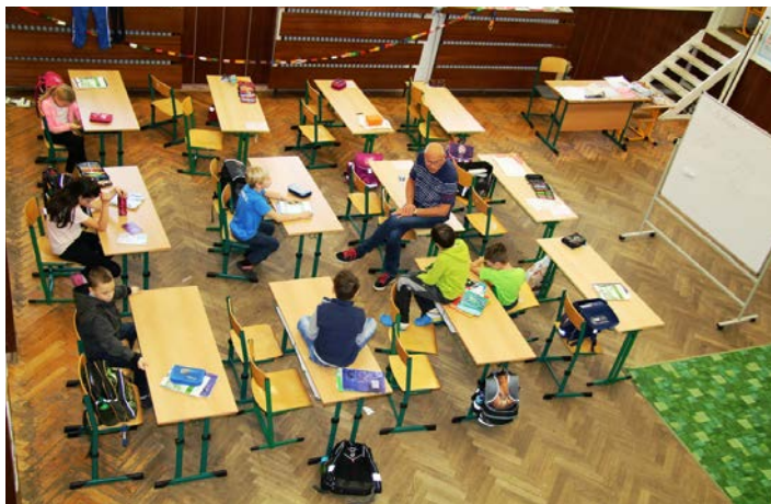
Vzpomínka na starou školu v kulturním domě

Není žádným tajemstvím, že od pondělí 6. 3. 2017 začalo probíhat vyučování v nové školní budově, na kterou jsme všichni s nadšením čekali. Stále ještě probíhají drobné dokončovací práce v okolí budovy. Při stavbě školní budovy musely ustoupit vzrostlé jehličnany, a tak v rámci pracovních činností zkusíme okolí školy osázet stromy novými, a také holá místa ozdobit záhony s květinami.