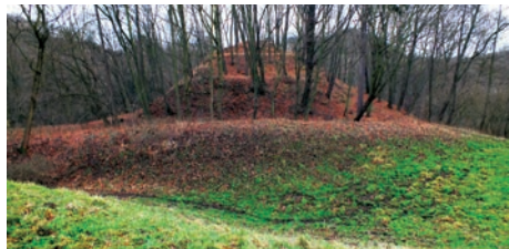
Pozůstatky hradu Varta.

Hrad Varta, který najdeme jihovýchodně od Olešnice (u Svádova), byl poprvé osídlen ve druhé polovině 13. století, pak byl z neznámých důvodů opuštěn. Jeho roli převzal nedaleký hrad nad Velkým Březnem, který je dnes zván Pustý zámek. Pak byl ze stejné záhadných důvodů opuštěn i hrad Velké Březno a v sedmdesátých letech 14. století znovu osídlen hrad Varta. O hrad Varta se svedla řada krutých bojů, ačkoli jeho pozice nebyla příliš