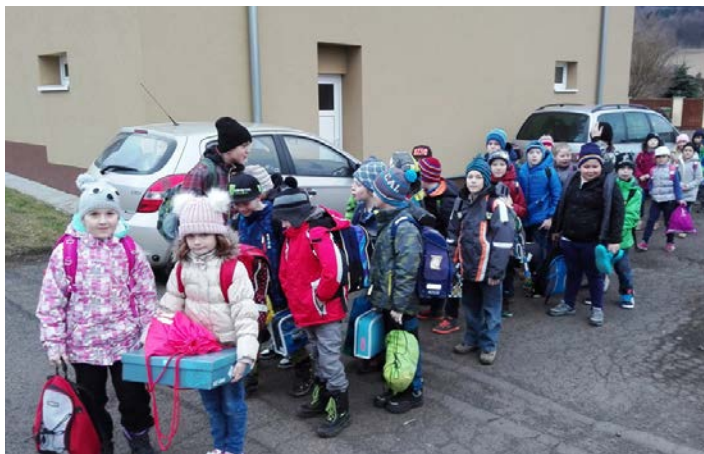
Cesta do nové školy