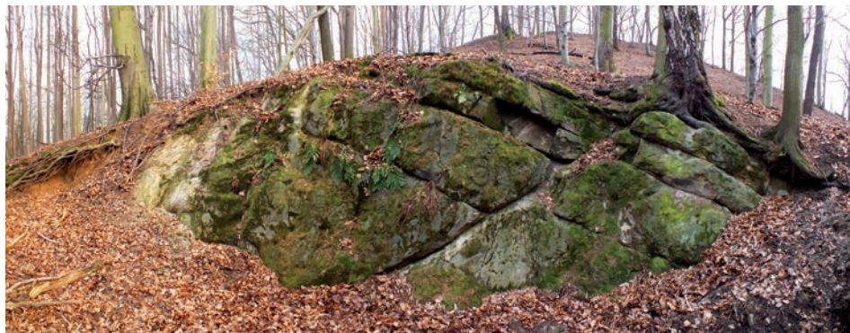
Pískovcová skála u hradu Varta se záhadnými reliéfy a nápisy.