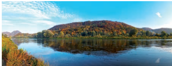
Tři tisíce let staré Hradiště nad Olešnicí.

Krátce řečeno – pro milovníky záhad a tajemných míst je okolí Olešnice přímo rájem.