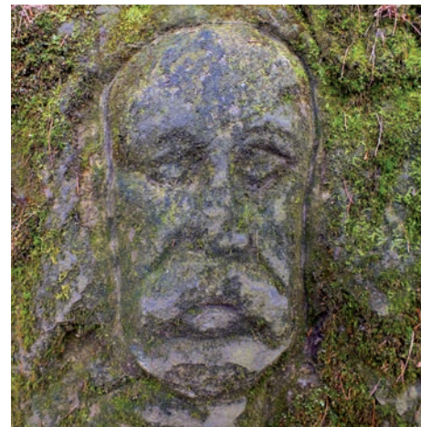
Jedna z kamenných tváří u hradu Varta.

V těsné blízkosti hradu Varta se nachází přírodní památka Loupežnická jeskyně na Zámeckém vrchu. Jde o jedinečný geologický fenomén – v tělese Zámeckého vrchu se nachází největší jeskyně v neovulkanitech České republiky. Je dlouhá asi 130 metrů a výškový rozdíl mezi jejím nejvyšším bodem (vchod) a nejnižším je více než 30 metrů. Jeskyně funguje také jako ventarola (přírodní výměník tepla) a v mrazech z ní stoupá teplá pára. Jeskyně je přístupná pouze pro odborníky – vstup do ní je bez speleologického vybavení prakticky nemožný. V jeskyni zimují chránění vrápenci, což jsou tvorové podobní netopýřům. Dle pověstí v jeskyni schovávali svůj ma-