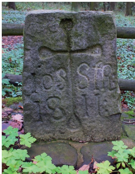
Památný kámen vztyčený na paměť lesníka ubitého ptytláky roku 1811.