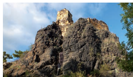
Strmý skalnatý suk hradu Kamýku.