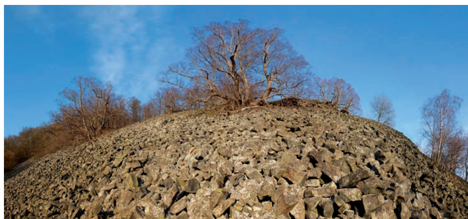
Kamenné moře na svazích Plešivce patří k nejrozsáhlejším v Českém středohoří.