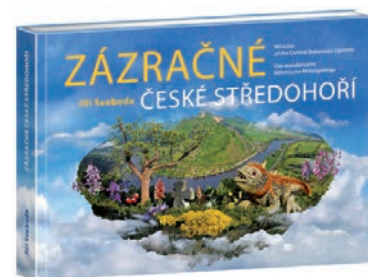
Nové zajímavosti najdete v knize Zázračné České středohoří od Jiřího Svobody. Více na: www.tajemstvistredohori.cz

V lese severovýchodně od hradu se nacházejí památné kameny vytvořené na památku zavražděného lesníka a jeho věrného psa, který zde zahynul steskem po svém zabitím pánovi. Památka se nachází při odbočce z modře značené cesty na Plešivec. Od budovy vodárny se dáme cestou vpravo. Po 150 metrech přijdeme na křižovatku cest a opět se dáme vpravo. Pak již jen na levé straně sledujeme pěšinu vedoucí krátce do lesa k památce. Je zde informační tabule.