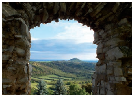
Pohled na Radobýl skrz okno v hradební zdi hradu Kamýku.

Pod hradební zdi se nachází vchod do poměrně rozlehlého sklepení, které je možná pozůstatkem tzv. bublinové jeskyně. Po modře značené stezce se můžeme vydat na nedaleký Plešivec, kde se pod rozsáhlým kamenným mořem nacházejí takzvané ledové jámy, kde se sníh a led mohou udržet až do léta.