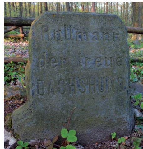
Památný kámen věrného jezevčika.

V lese severovýchodně od hradu se nacházejí památné kameny vytvořené na památku zavražděného lesníka a jeho věrného psa, který zde zahynul steskem po svém zabitím pánovi. Památka se nachází při odbočce z modře značené cesty na Plešivec. Od budovy vodárny se dáme cestou vpravo. Po 150 metrech přijdeme na křižovatku cest a opět se dáme vpravo. Pak již jen na levé straně sledujeme pěšinu vedoucí krátce do lesa k památce. Je zde informační tabule.