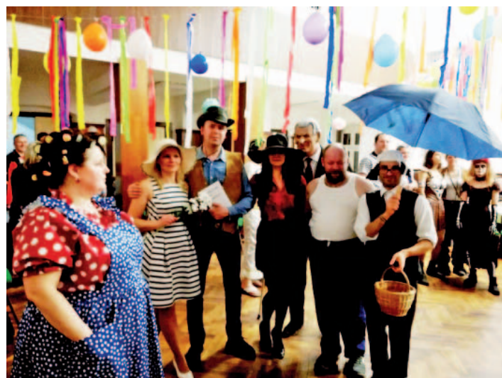
Filmové postavy jako živé...