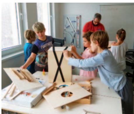
Výroba hudebních nástrojů „cajónů“.

Nezahálíme ani v mateřské škole. Děti pravidelně chodí tvořit do keramické dílny a zdraví tuží v solné jeskyni. Během celého roku k nám přicházejí různí, zajímaví lidé s krásnými a poučnými představeními. Prosinec byl nabitý spoustou příjemných chvil. Objevil se u nás Mi-