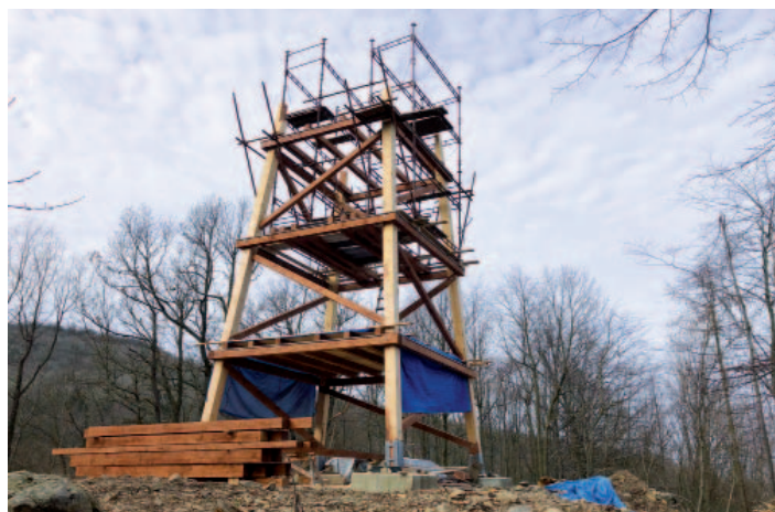
Snímek stavby ze dne 24. února 2019.

10. listopadu 2018 byly pomocí autojeřábu umístěny prostřední části nosných rohových trámů.