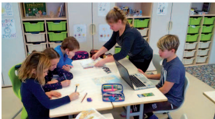
Projektový den o zemských světadílech.

Další jednodenní projekt nás nejen poučil, ale i prakticky naučil, jak předcházet požárům. Když už požár nastane, tak si poradíme i s hasičím přístrojem.