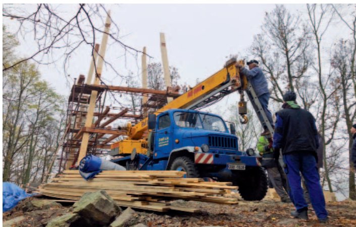
Umísťování prostředních částí nosných rohových trámů.