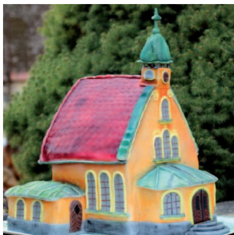
Nádherný výroční šestnáctikilový dort.

Každoročně se účastníme celorepublikové akce „Uklidíme Česko“, a tak tomu bude i letos. Opětovně sesbíráme plechovky a petlahve od piva, kterým se podél silnic daří víc než místním rostlinám. Asi nikdy nepochopíme,