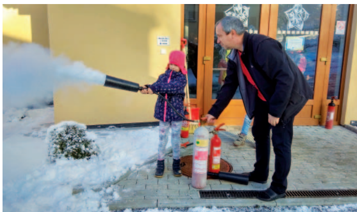
Snímek z projektového dne na téma předcházení požárům.

Další jednodenní projekt nás nejen poučil, ale i prakticky naučil, jak předcházet požárům. Když už požár nastane, tak si poradíme i s hasičím přístrojem.