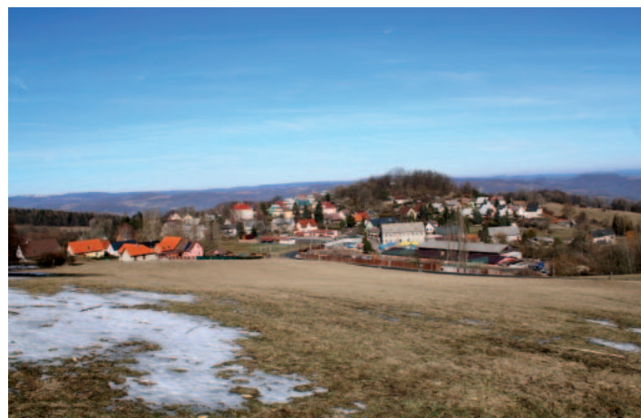
Srovnání historického a současného pohledu na obec Malečov.