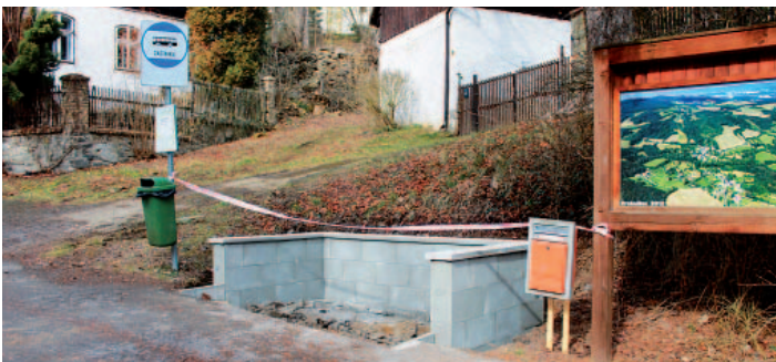
Stavba autobusové zastávky v Proboštově.

Termín veřejného projednání návrhu územního plánu ještě není znám, ale věřím, že by se projednávání mohlo uskutečnit letos v září nebo v říjnu. Je to ještě období stanovisek, námitek a připomínek, než Zastupitelstvo obce návrh na vydání územního plánu schválí a územní plán vydá.