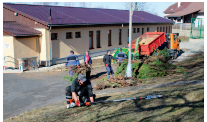
Veřejně prospěšní pracovníci při své činnosti.

Děkuji za rozhovor, Stanislav Hladký, 7. 3. 2019