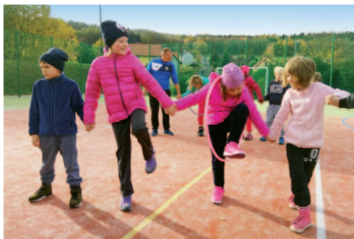
Listopadový tělocvik v rámci projektu „Škola v pohybu“.