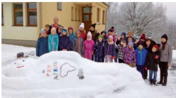
Společné foto z charitativní akce „Sněhuláci pro Afriku“.

kuláš a rozdál dětem balíčky, které si musely zasloužit hezkou básničkou nebo písničkou. Společně s rodiči tvořily děti ve školce rozmanité vánoční výrobky při „vánočních dílničkách“. A vše završila vánoční besídka plná písniček, básniček, pohybových her a pohádek. Všechny děti se účastnily s nadšením; a nejednomu rodiči ukápla slzička.