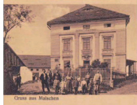
Historické snímky kulturního domu.

kému okresu, paralelní český název oficiálně platil od r. 1854.