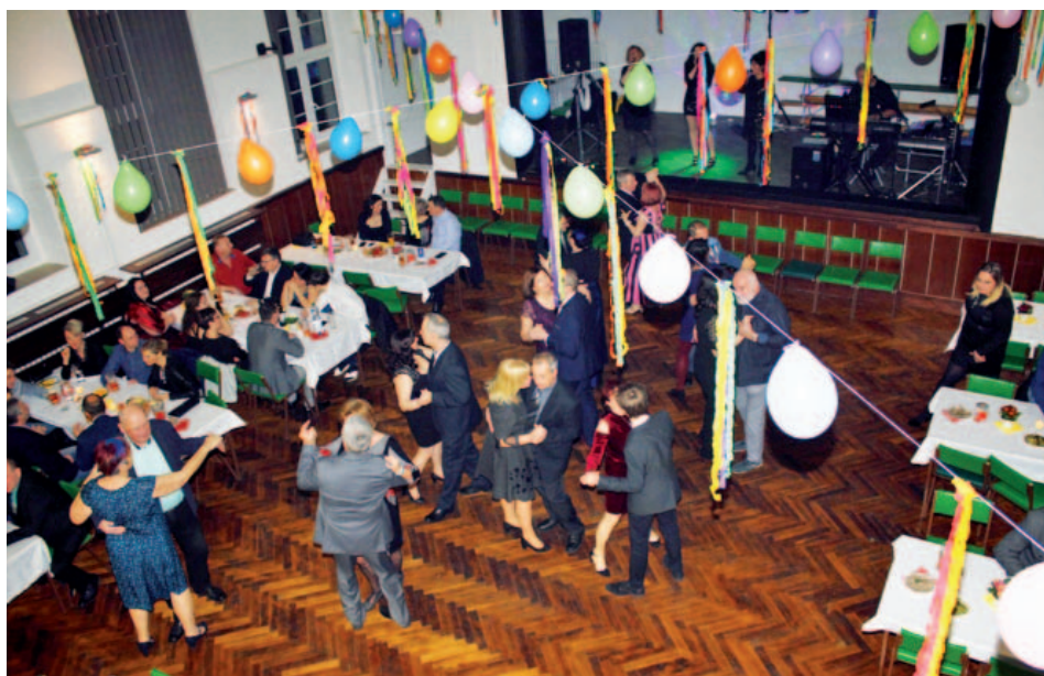
Každoroční oslava založení našeho spolku.

jak se můžou někteří lidé chovat k přírodě takovým hloupým způsobem. Proč vyjíždějí z měst a svých domů jen proto, aby vyhazovali odpadky z oken svých aut, lze jen těžko domýšlet... I když v posledních letech je srážková činnost a jarní tání skoro bezvýznamné, kolem břehu potoka je také spousta nápojových obalů, které tam přibýly bůhví odkud. I kdyby místní zvěř dodržovala žádaný pitný režim, věříme, že by po sobě takový nepořádek nezanechala. Naše úklidová akce se uskuteční v sobotu 6. dubna 2019, sraz je v 9 hodin na spodní točně u můstku.