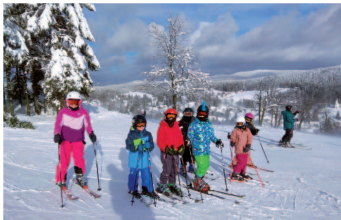
Na škole v přírodě v Bedřichově jsme si zalyžovali.