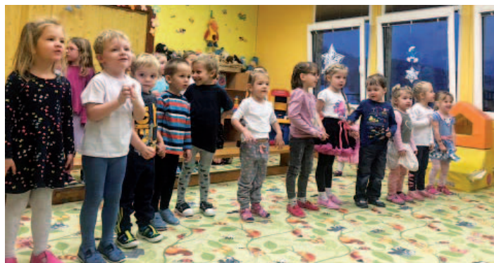
Z vánoční besídky v mateřské škole.

Termín zápisu do 1. ročníku ZŠ je v úterý 9. 4. 2019 od 13.00 do 17.00 hod.