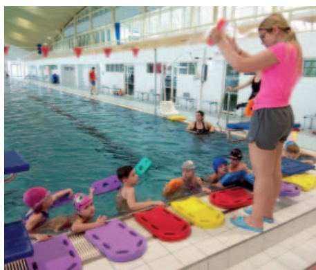
Výuka plavání v Ústí nad Labem.