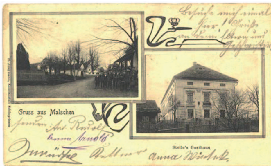
Historická pohlednice s bývalou kapličkou a kulturním domem.