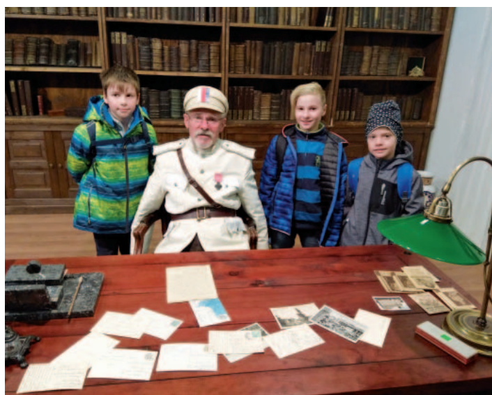
Snímek z oslav 100. výročí založení Československé republiky.

V rámci projektového dne jsme se dozvěděli spoustu zajímavostí o jednotlivých světadílech.