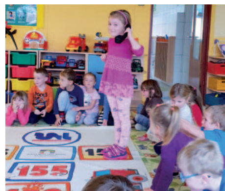
Škola hra v mateřské škole.