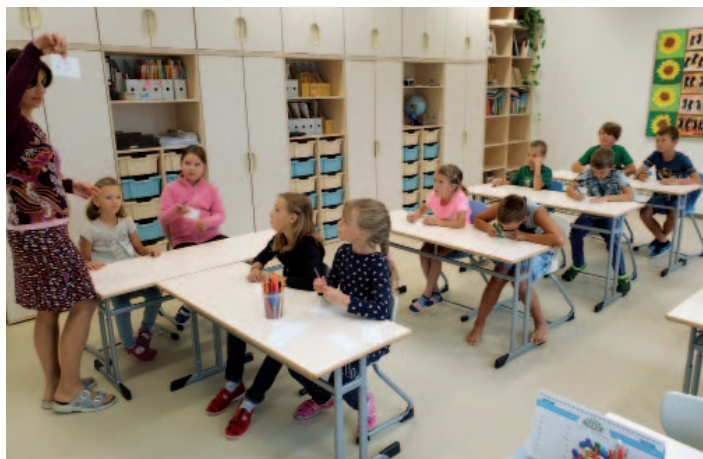
Nová paní učitelka s dětmi 2. a 3. ročníku.