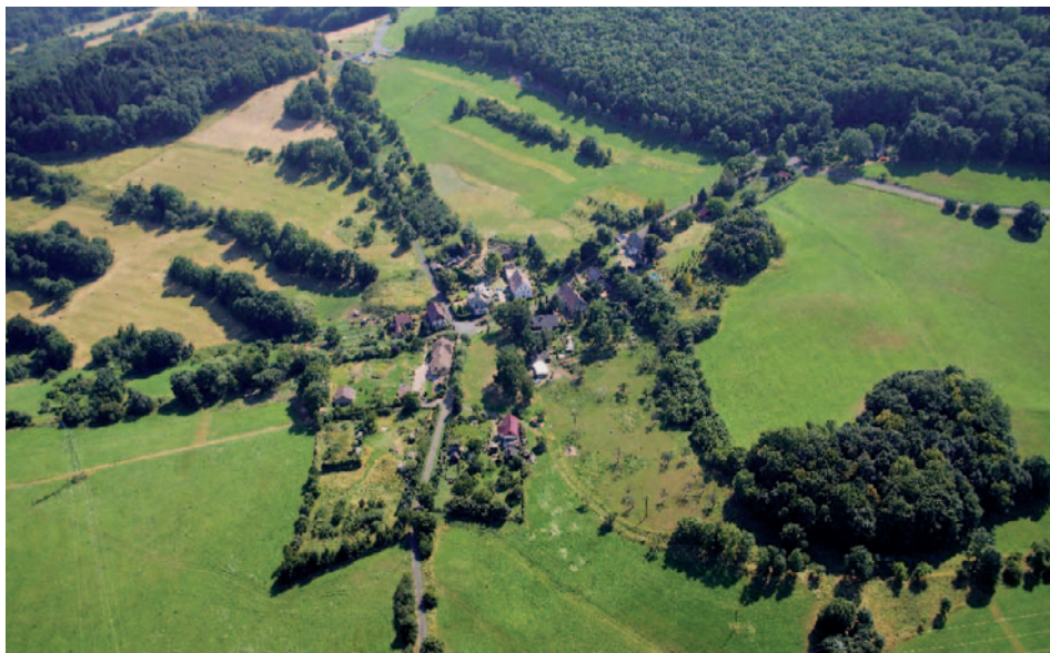
Letecký pohled na Pohoří z roku 2015.