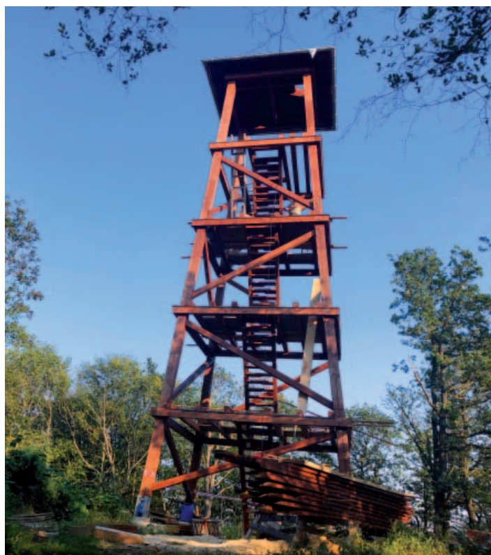
Stav rozhledny ke dni 31. 8. 2019.

Průběh stavby nás navedl k možnému termínu slavnostního otevření, a to v sobotu 26. 10. 2019 u příležitosti výročí vzniku samostatného československého státu. Není to však jisté. Nejde jenom o vlastní stavbu, ale i o náležitosti, které nejsou na první pohled patrné. Rozhledna musí být před otevřením zkolaudována, což v prvé řadě podmiňuje zápis odděleného pozemku pod rozhlednou do katastru nemovitostí. Celou velkou lesní parcelu na Lucemburkově kopci obec Malečov v roce