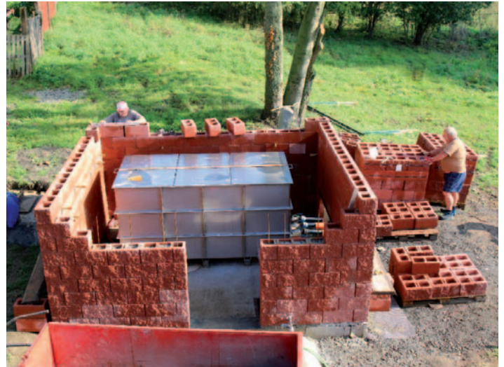
Snímek z rekonstrukce vodního rezervoáru v Rýdeči.

Dne 22. 10. 2019 se od 17.00 do 20.00 hod. uskuteční setkání pro seniory „Tancuj se mnou dnes II.“ s duem ADAMIS. Akce se bude konat na sále kulturního domu v Malečově.