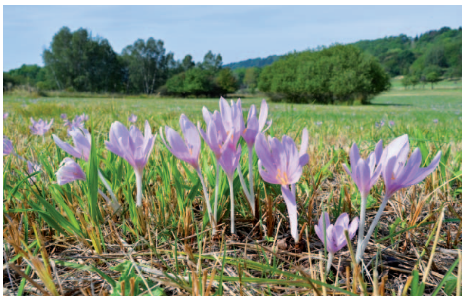
Bohatství kvetoucích ocunů jesenních na Babinských loukách.

Text a foto: Jiří Svoboda, autor publikací Tajemství Českého středohoří a Zázračné České středohoří.