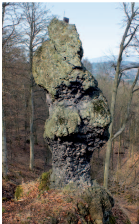
Zkamenělý úředník v podobě pozoruhodného skalního sloupu – a ten samý obrázek skály dotvořený pomocí kresby, pro pobavení čtenářů.

Ačkoli to může znít zvláštně, příběh je určitou reflexí reálných událostí. Odehrálo se zde