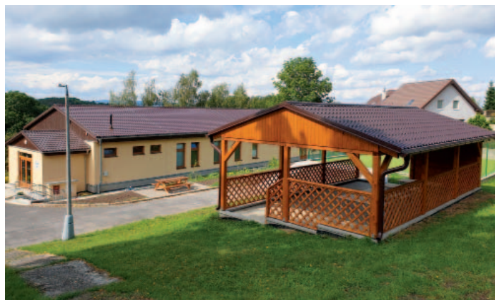
Prostor pro venkovní vyučování je dokončen.