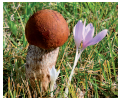
Hříby zde rostou často společně s ocuny.

Podle pověsti hospodařil ve Staňkovicích chudý chalupník. Měl krásnou dceru. Do půvabné dívky se zamiloval panský úředník. Dívka však panského úředníka za manžela nechtěla a rodiče svou dceru do sňatku nechtěli nutit. Panský úředník se proto rozhodl, že se rodině pomstí. Z titulu své moci zařídil, aby rodina musela svůj domov opustit a ze Staňkovic odejít. Když chalupník se svou ženou a dcerou smutně odcházeli přes Dlouhý vrch, panský úředník se za nimi díval. Netušil ale, že jej sle-