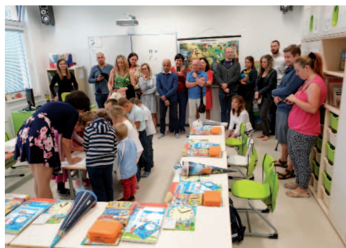
Dva snímky z přivítání prvňáčků.