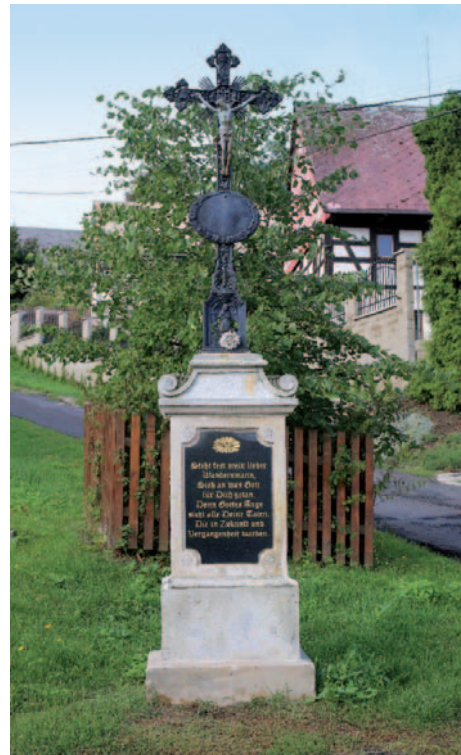
Boží muka na návsi v Pohoří.