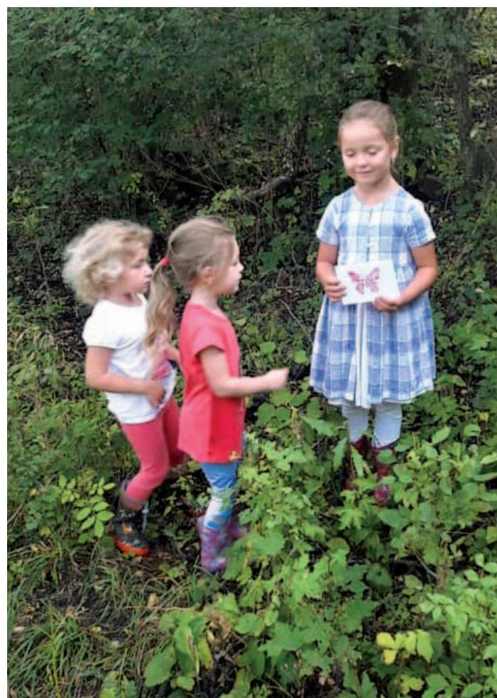
Výprava dětí z mateřské školy za pokladem s Lesníčkem.