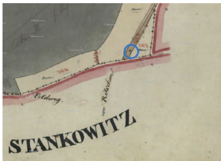
Indikační skica stabilního katastru, rok 1843.