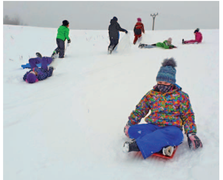
Letošní bohatá sněhová nadílka byla příležitostí pro klasické zimní radovánky.