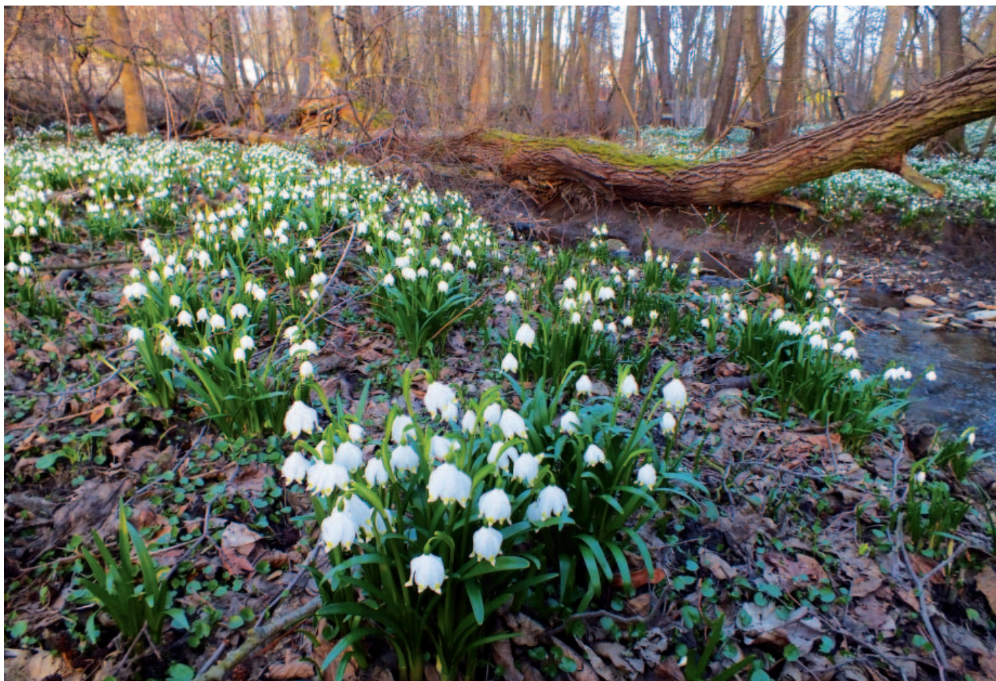
Rozkvetlé bledule v údolí potoka Rytiny protékající Čeřeništěm.