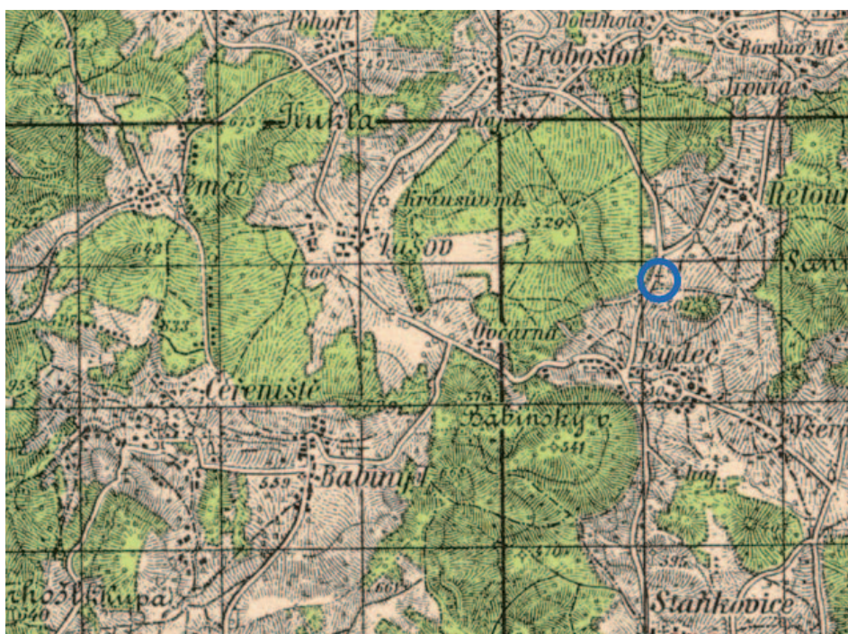
Vojenské mapování, roky 1876 – 1879.