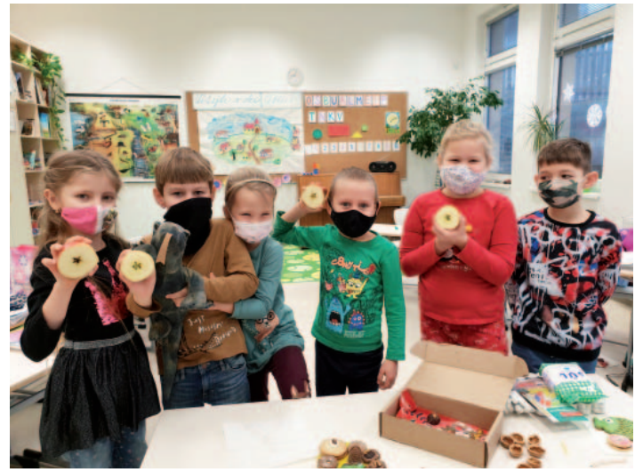
Dětem jsme se snažili zpestřit výuku ve stylu Komenského hesla „škola hrou“, včetně besídky s vánočními tradicemi.