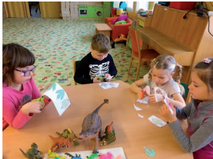
Oblíbeným tématem nejmenších dětí jsou dinosauři. A tak se ve školce tvořilo a tvořilo...

Před měsícem proběhla ve škole nutná investice do počítačové sítě a jejího zabezpečení, která doplnila podzimní investici do nového vybavení. Mateřskou školu jsme v únoru vybavili moderním interaktivním panelem. Na léto je naplánovaná úprava interiéru školky.