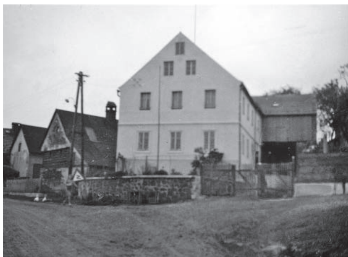
▲ Malečov, rok 1943.