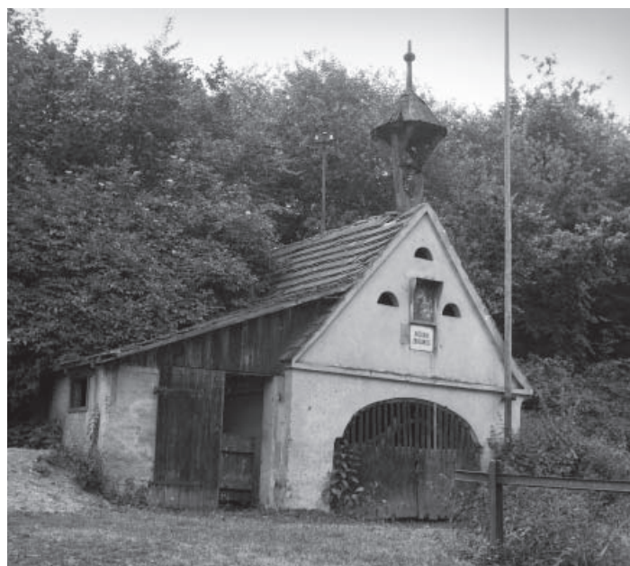
► Horní Zálezly, rok 1925.