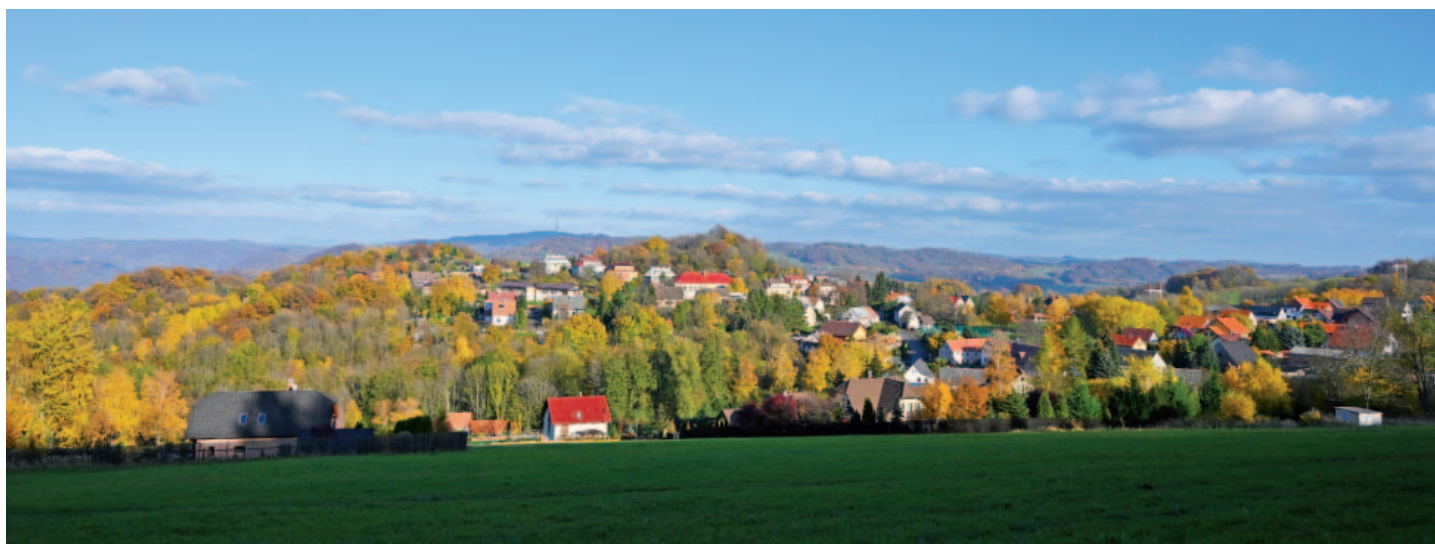
Současný pohled na obec Malečov od západního úpatí Širokého vrchu (659 m n. m.).