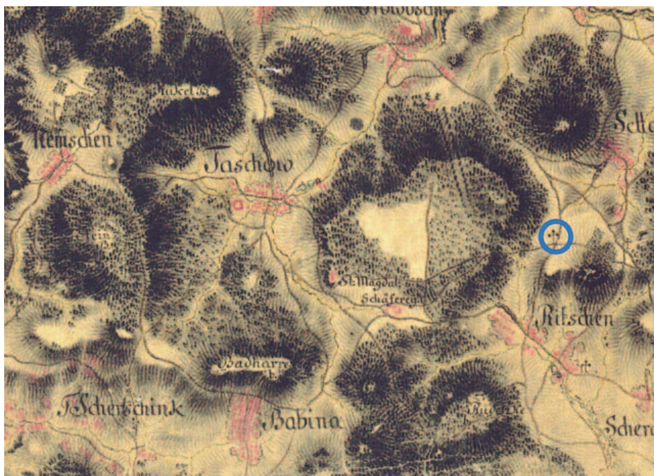
Vojenské mapování, roky 1764 – 1768.

Pro sbírku peněz na odstranění vlhkosti ze základů kostela byl založen speciální účet č. 9661917036/5500. Je možné uzavřít daro-