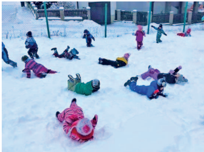
Plnými douškami jsme využívali sněhové nadílky a utužovali zdraví dětí na čerstvém vzduchu.

V plánu máme do konce školního roku realizaci dvou projektových dnů. Školka, doufejme, navštíví IQ Park v Liberci a školáci se v červnu vydají do ZOO Praha. Ostatní plánované akce se vzhledem k epidemiologické situaci neuskuteční.