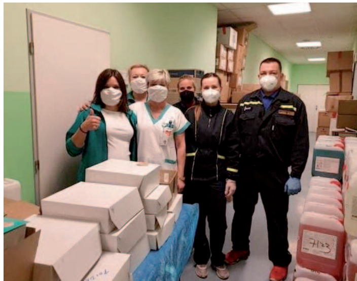
SDH Malečov ve spolupráci s OÚ Malečov a Spolkem žen Malečov poděkovaly pracovníkům Masarykovy nemocnice v Ústí n. L.