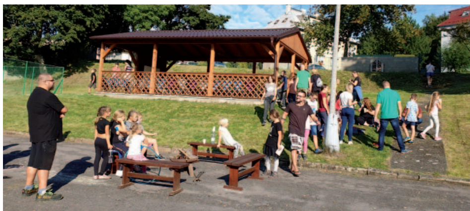
Setkání s rodiči po úvodní třídní schůze proběhlo v zábavném duchu.

Tento rok směřujeme k formativnímu hodnocení v ZŠ i MŠ. Učíme děti, aby samy uměly ohodnotit svůj výkon i práci svých kamarádů. Je to jedna z důležitých podmínek, aby děti byly dobře motivované a práce ve škole je bavila.