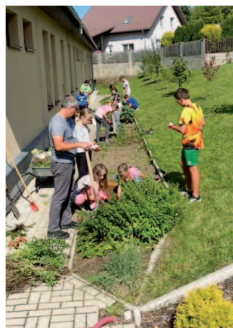
Děti v rámci pracovní výchovy obdělávají školní záhon.