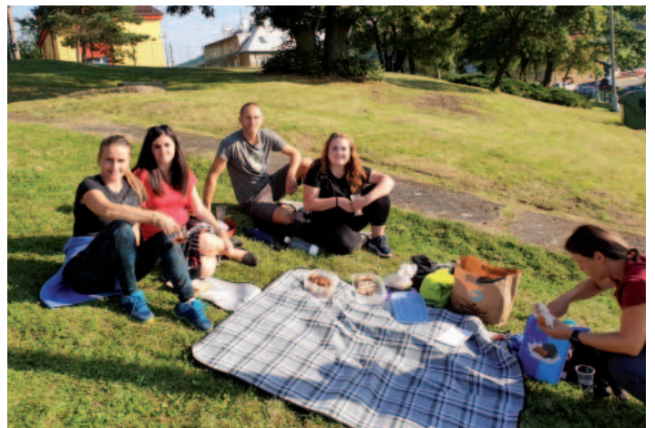
Na setkání s rodiči a dětmi po první třídní schůzce nechybělo slunce ani opékání buřtů.