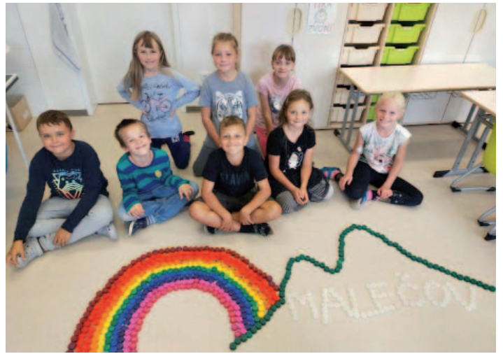
Duhu nad kopcovitou krajinou Malečovska vytvořily děti v rámci výtvarné výchovy z víček od plastových lahví.