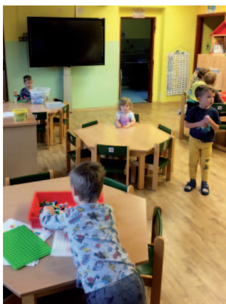
Nově upravené prostory obou tříd mateřské školky.