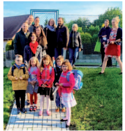
První školní den je vždycky velkou událostí pro děti, jejich rodiče i pedagogy.