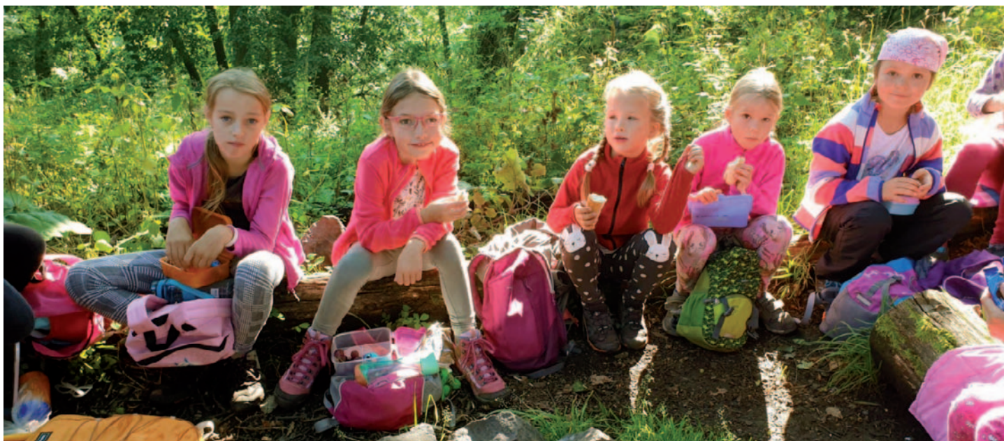
Snímky z výletu na Vysoký Ostrý.