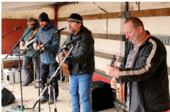
Hudební skupina Desperádi na Velikonočních trzích v Malečově.