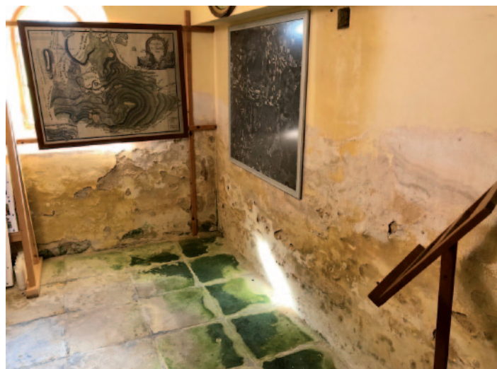
Snímky poškození interiéru kostela Panny Marie v Čeřeništi, které je způsobeno vztlínající vlhkostí.