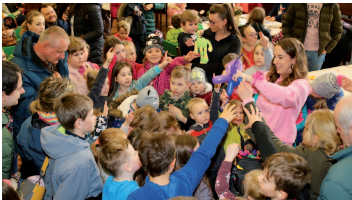
Balónková Evička měla tradičně velký úspěch.

Všem výše zmíněným a dalším, kteří se jakkoli podíleli na akcích a přípravách na ně, patří naše velké poděkování!