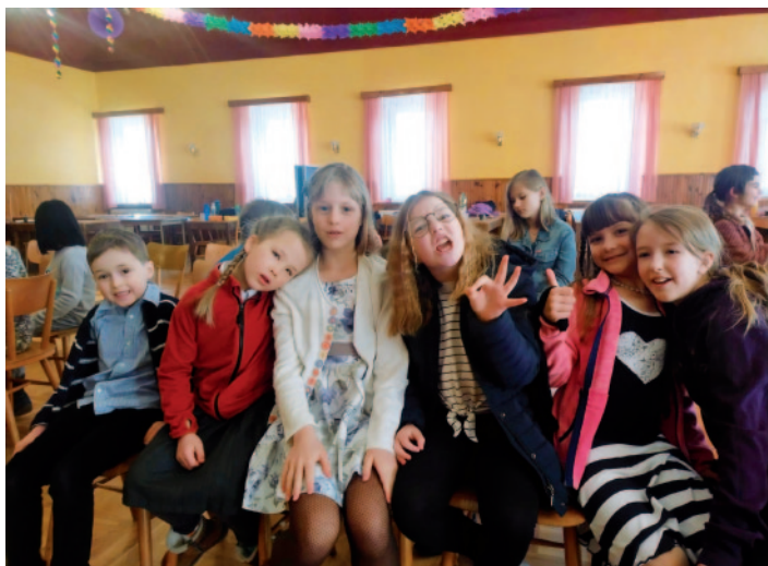
Snímek z březnové recitační soutěže školáků v Petrovicích.

V březnu v rámci preventivního programu proběhlo ve škole interaktivní divadelní představení s názvem „Prožij si to“. Školku zase navštívilo se svým představením divadélko Koloběžka. V březnu vyrazily děti ze