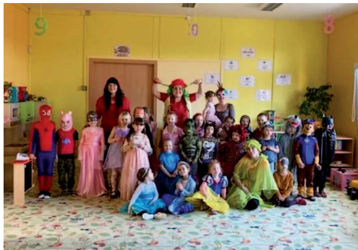
Tradiční březnový karneval ve škole.

školky za kulturou do litoměřického divadla Máj na pohádku „O princezně, Lucíašovi a makových buchtách“. A nesmíme zapomenout ani na tradiční školkový karneval.