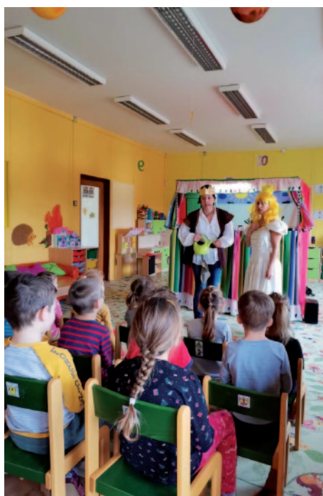
V březnu školu navštívilo se svým představením divadlo Koloběžka.