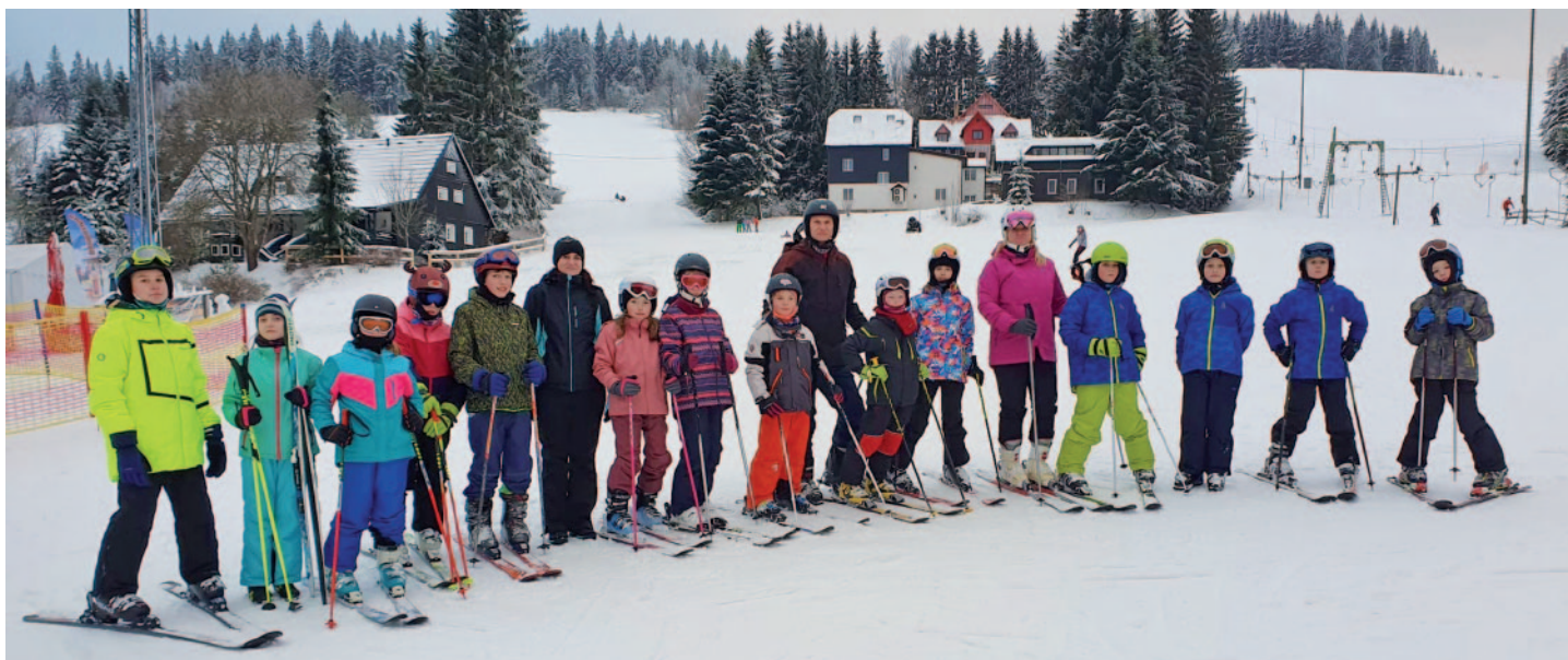
Lednová škola v přírodě byla spojena s výukou lyžování.