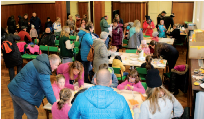
Tvorba velikonočních dekorací v prostorách kulturního domu.