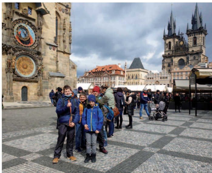
Dubnový výlet školáků za poznáním Prahy a naší historie.