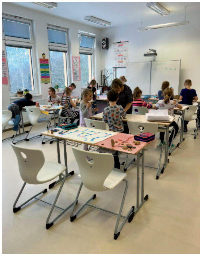
Snímek ze školního kroužku „Tvořivá dílna“.

Na začátku dubna vyrazili školáci za poznáním Prahy a naší minulosti. Projít si místa, kde žili a vládli naši panovníci, a nechat pracovat svou představivost – to žádná učebnice nenahradí. Ve stejném týdnu děti ze školy a předškoláci z MŠ navštívili divadelní představení „Malá mořská víla“.