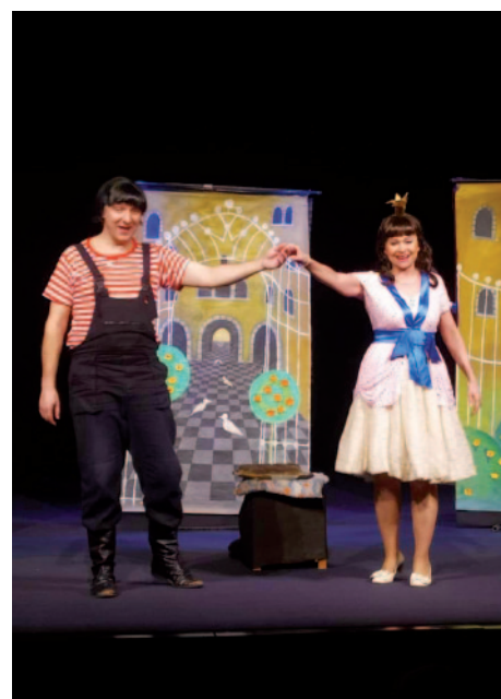
V březnu vyrazily děti ze školky za kulturou do litoměřického divadla Máj na pohádku „O princezně, Luciášovi a makových buchtách“.