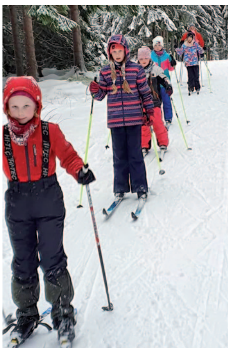
Děti na běžkách v rámci výuky lyžování na lednové škole v přírodě.