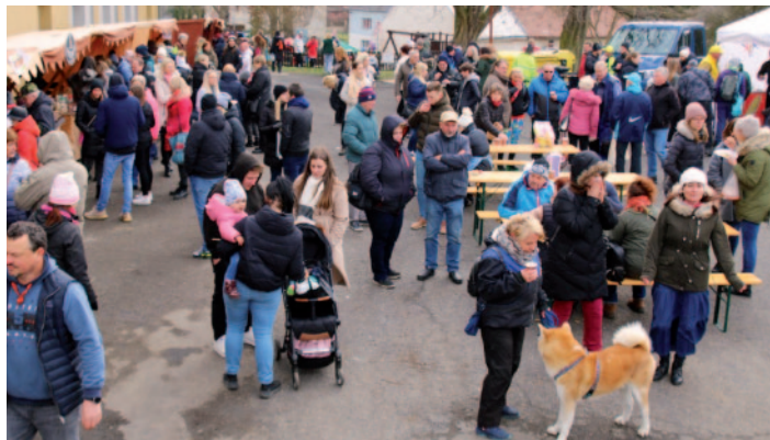
Velikonoční trhy v Malečově měly hojnou návštěvnost.