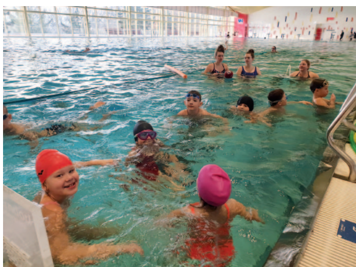
Výuka plavání v plavecké hale na Klíši v Ústí nad Labem.