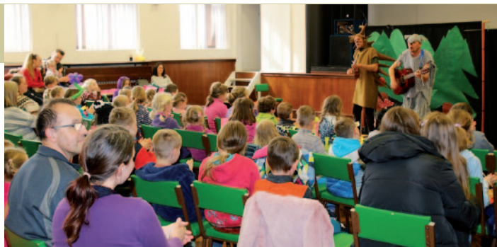
Divadlo Krabice Teplice zahrálo pohádku „Kde je ten ježek?“