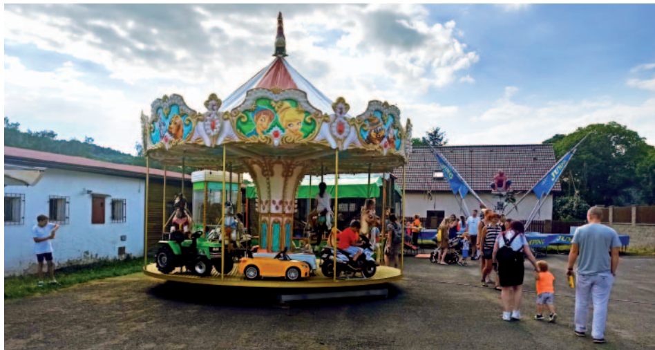
Na dětském dni v Malečově nechyběl kolotoč ani další dětské atrakce.