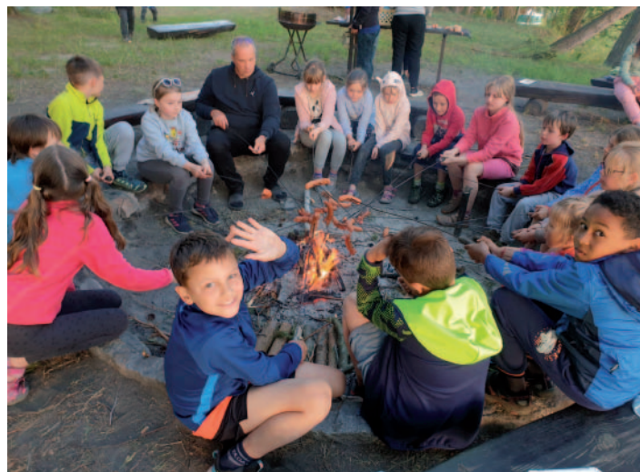
Na přelomu měsíce května a června si všichni užili oblíbenou školu v přírodě v Holanech.