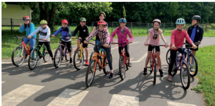
KVĚTEN – žáci 4. a 5. ročníku se zúčastnili dopravní výchovy s praktickými jízdami na dopravním hřišti městské policie v Krásném Březně. Ti úspěšní po znalostním testu obdrželi symbolické řidičské oprávnění.