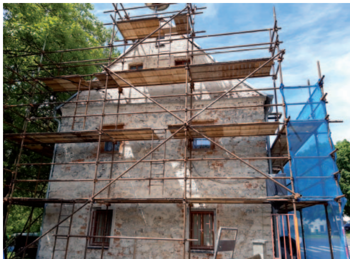
Oprava fasády domu č. p. 18, kde je provozován obchod.