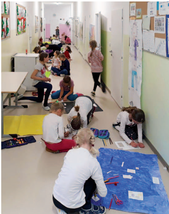
DUBEN – jako každý rok se žáci těší na Noc skřítků, kdy stráví ve škole noc.

Od 1. 9. 2022 je škola nucena zvýšit ceny stravného, pro více informací sledujte stránku školy – www.zsmalecov.cz .