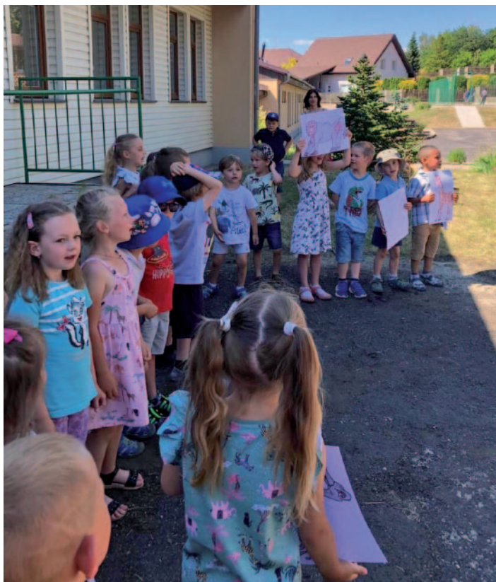
V zahradě školy proběhl tradiční piknik – společné setkání rodičů, dětí, žáků a přátel školy. Děti s učiteli pro všechny připravili malý kulturní program, a také proběhlo „pasování“ předškoláčků na školáčky ☺