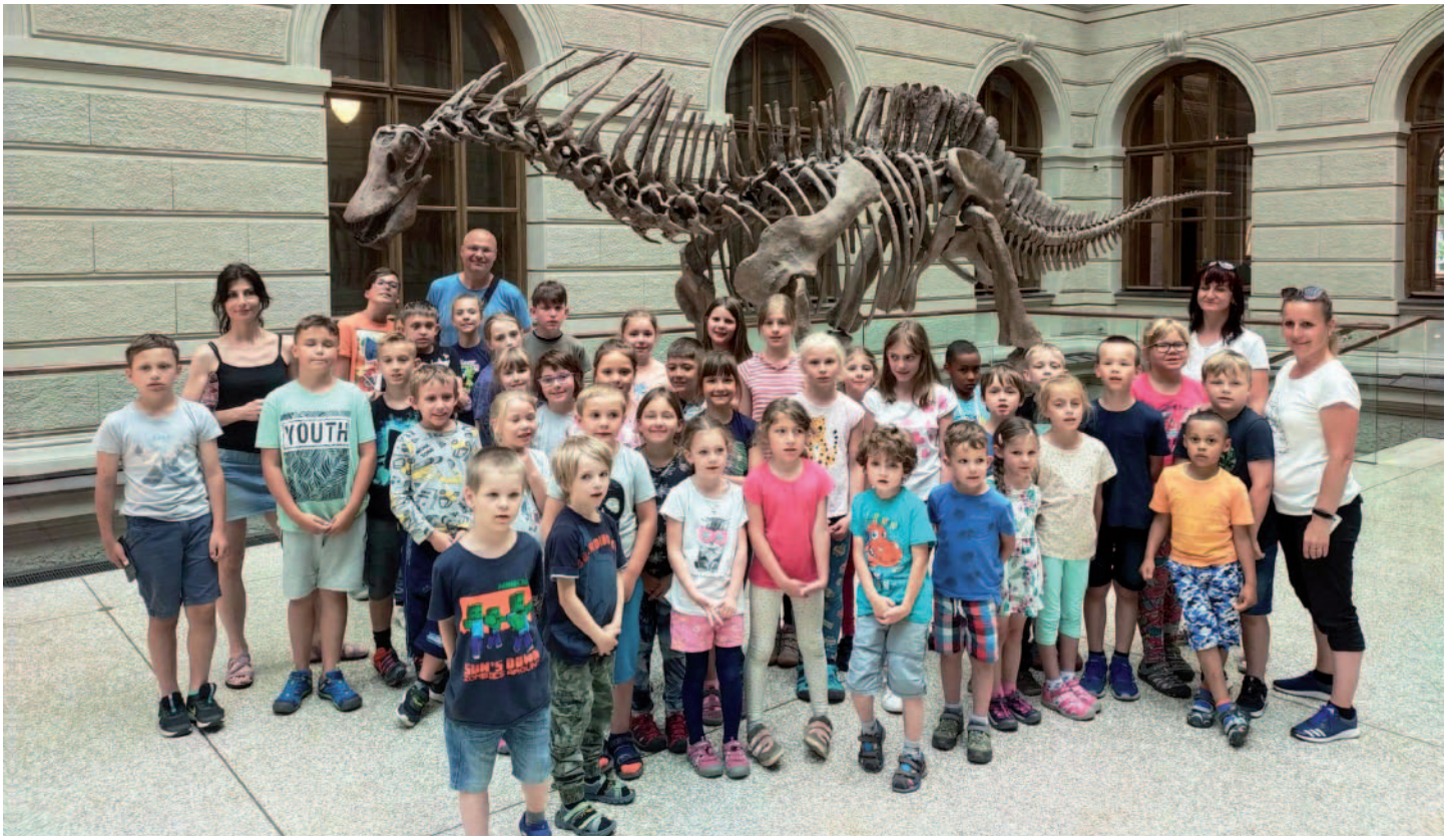
V posledních červnových dnech jsme opět navštívili Prahu, tentokrát Národní muzeum. Expozice o evoluci s mnoha zajímavými zvířaty se líbila i malým předškolákům. A teď už víme, jak vypadal mamut!