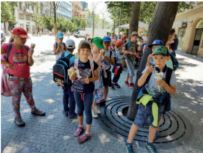
Nezapomenutelný zážitek si dětičky odnesly také z Václavského náměstí, kde jsme si jako praví turisté vystáli frontu na zmrzlinu!