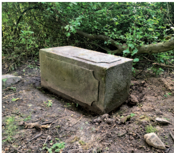
Dochovaný kamenný sokl kříže z roku 1834.