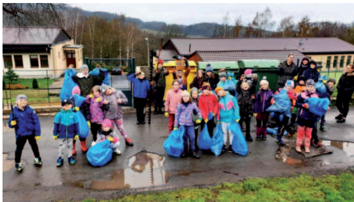
DUBEN – v týž den pod hlavičkou akce Den Země děti uklízely v okolí školy. I přes aprílové počasí dobrá nálada nechyběla.