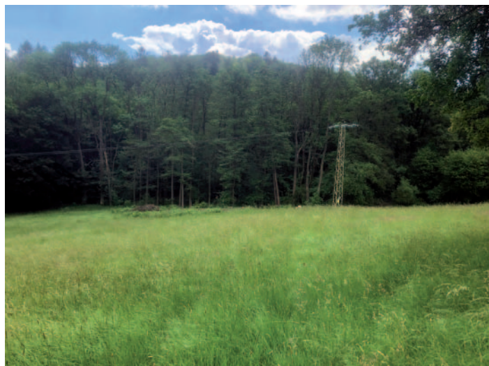
Dva snímky, na nichž je možné porovnat stav před a po vyřezání náletového hájku, v němž se ukrýval zbytek kříže z roku 1834.