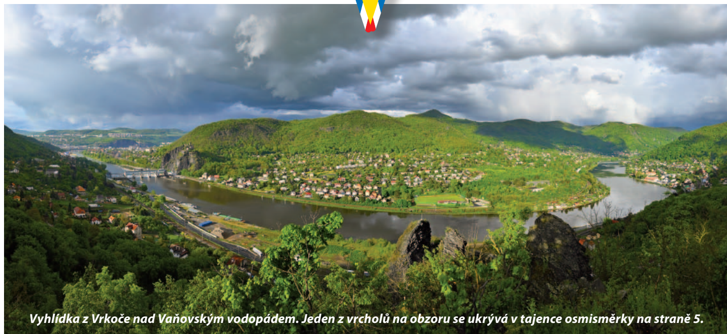
Vyhlídku z Vrkoče nad Vaňovským vodopádem. Jeden z vrcholů na obzoru se ukrývá v tajence osmisměrky na straně 5.