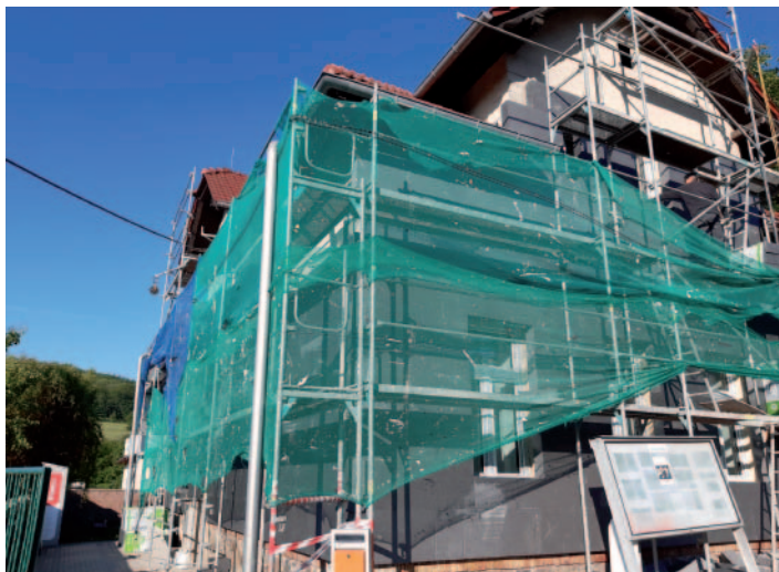
Snímek z probíhajícího zateplení budovy OÚ v Malečově.