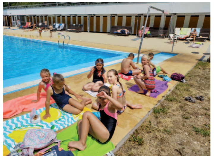
Poslední školní týden, kdy o sobě sluníčko dávalo opravdu vědět, jsme si udělali pěší výlet na koupaliště v Brně.