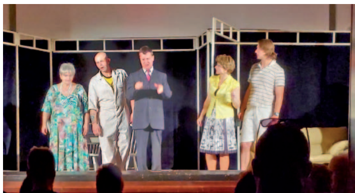
Snímky z divadelního představení v Kulturním domě Malečov. Účast byla opravdu hojná.