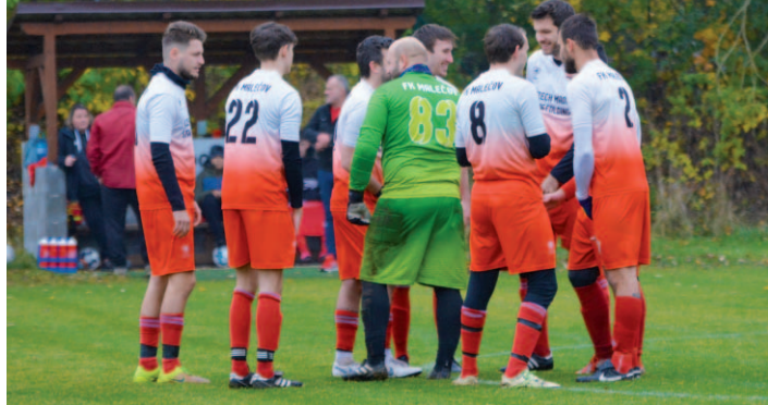
FK Malečov–TJ Libouchec B (7:2)