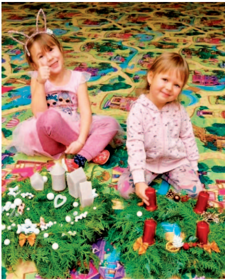
Snímek z akce „tvoříme s rodiči“.