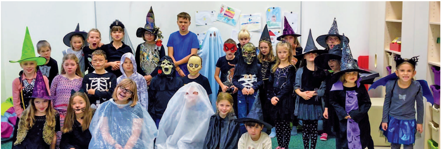
Také pro žáky základní školy jsme uspořádali Halloween s maskami.