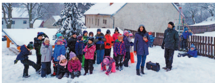
Letošní akce „Vánoce na vsi“ byla opravdu bílá.