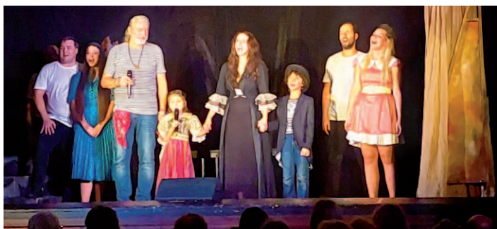
Snímek z představení „Bez hvězdy to nepůjde“.