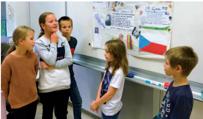
Projektový den o české státnosti.