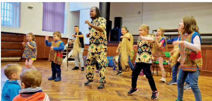
Snímek z multikulturního představení na základní škole.