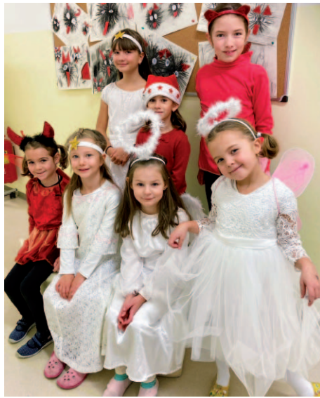
Roztomilí čertíci a andílci na Mikuláše.