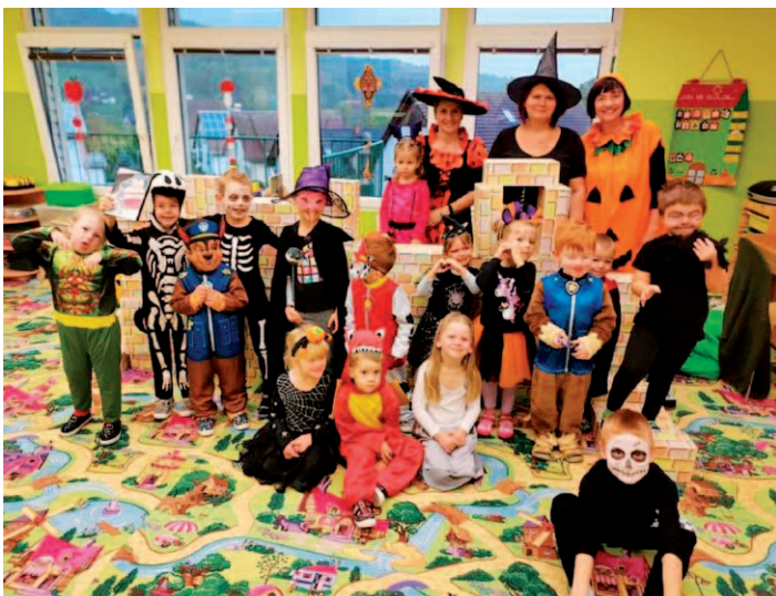
Halloween pro děti v mateřské škole byl plný krásných masek.

Přejeme všem dětem i jejich rodičům krásné svátky a šťastný nový rok!