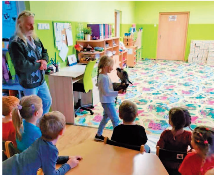
Pro naše předškoláky jsme uspořádali besedu o našem ptactvu.