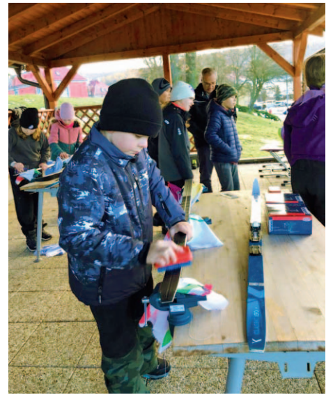
Příprava žáků na lyžák.