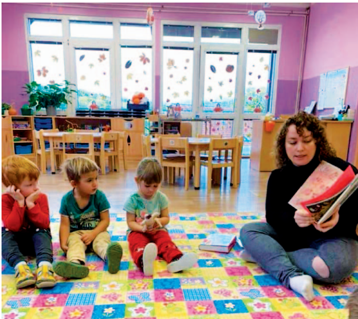
Beseda o knihách pro děti v mateřské škole.