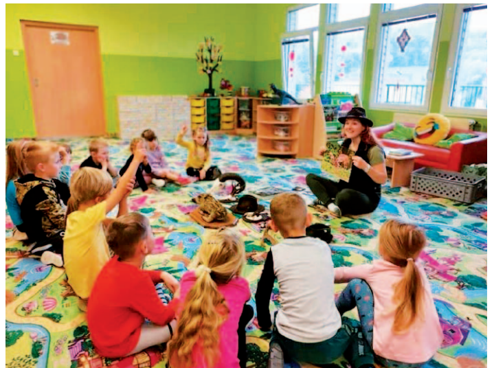
Na besedě pro malé myslivce se děti učily rozpoznávat zvířátka.