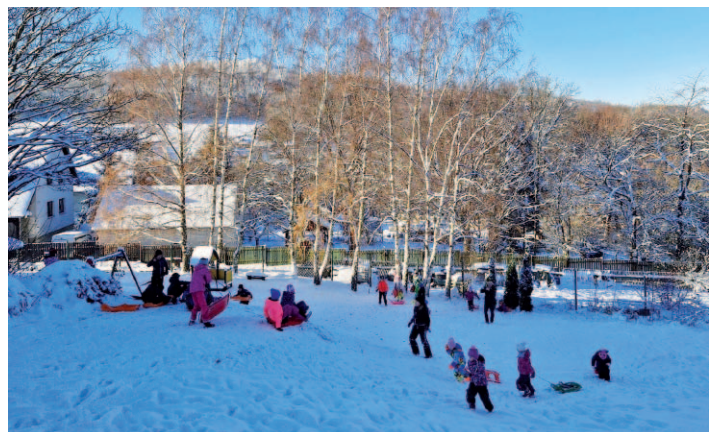
Díky časně bílé zimě jsme mohli se školáky vyrazit bobovat.