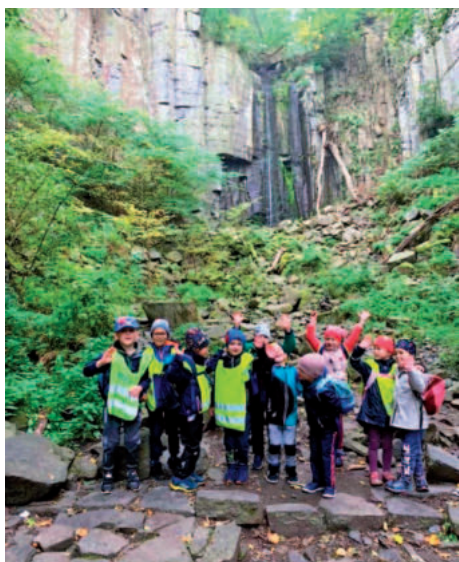
Děti ze školky se vydaly na Erbenovu vyhlídku a také k Vaňovskému vodopádu.