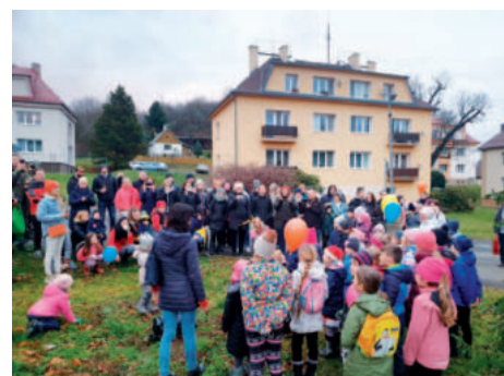
Předvánoční zpívání v Malečově.

Zaměstnanci školy přejí všem občanům Malečovska příjemné prožití vánočních svátků a hezký nový rok.