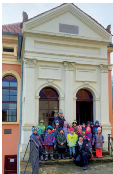
Návštěvu Muzea čertů v Úštěku jsme spojili s návštěvou staré školy v úštěcké synagoze.