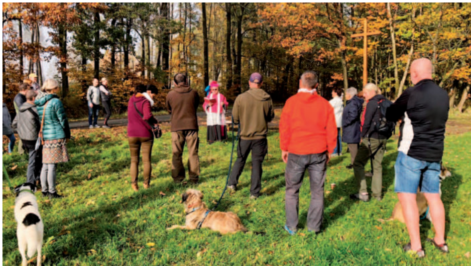
Požehnání kříže nad Rýdečí proběhlo dne 22. října 2022.