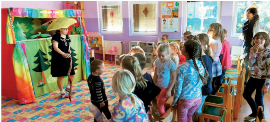
Naše děti jsou rády, když za nimi přijede divadlo.

S příchodem adventu vyrazila téměř celá škola do Úštěku za čerty. Děti si statečně prohlédly celé peklo a Pikartskou věž. Protože se jednalo o školáky a předškoláky, navštívili jsme také starou školu v místní synagoze.