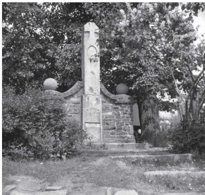
Válečný pomník, který stál původně v centru Malečova.

Předpokládané náklady na úpravy jsou cca 25 000 Kč, z čehož největší položku tvoří vyzlacení písmen a dvou obrazů. Při ceně vyzlacení jednoho písmene za 40 Kč (celkem 513 písmen) a jednoho obrazu za cca 500 Kč je celková cena zlacení cca 21 500 Kč. Ostatní práce budou provedeny svépomocí, zbývající 3500 Kč z předpokládaných nákladů budou