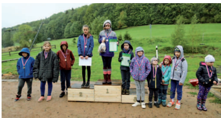
Účastníci a vítězové závodu v kategorii „dětí“.