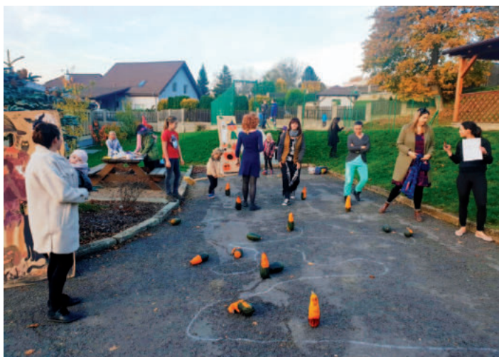
U dětí slavilo velký úspěch i zábavné Halloweenské odpoledne.