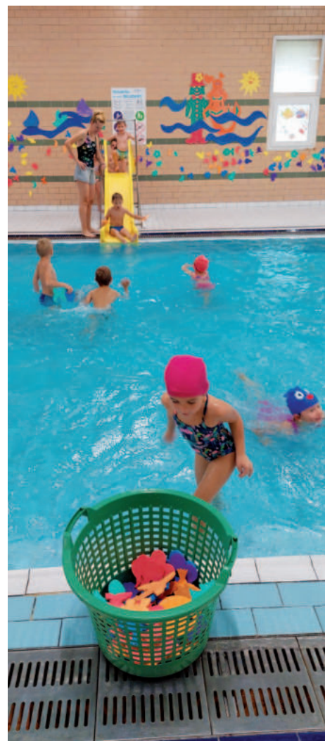
Kurz plavání v Litoměřicích.

Školu i školku navštívil Mikuláš s Andělem a Čertem. Básničky i písničky nás ochránily a stavy školáků se naštěstí nesnižovaly.