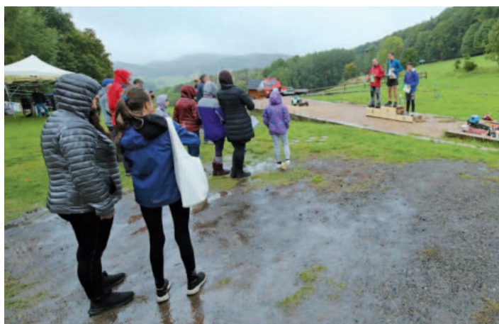
Muži na stupních vítězů.