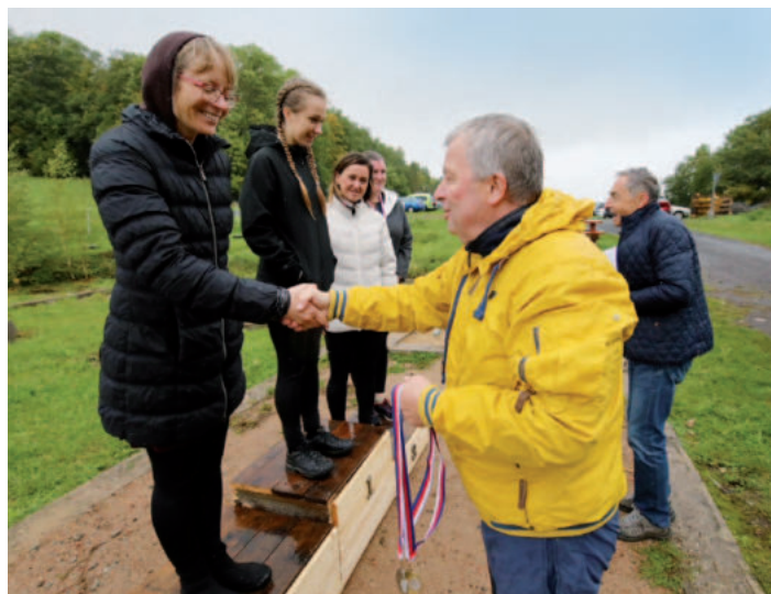
Gratulace a předávání cen vítězným ženám.