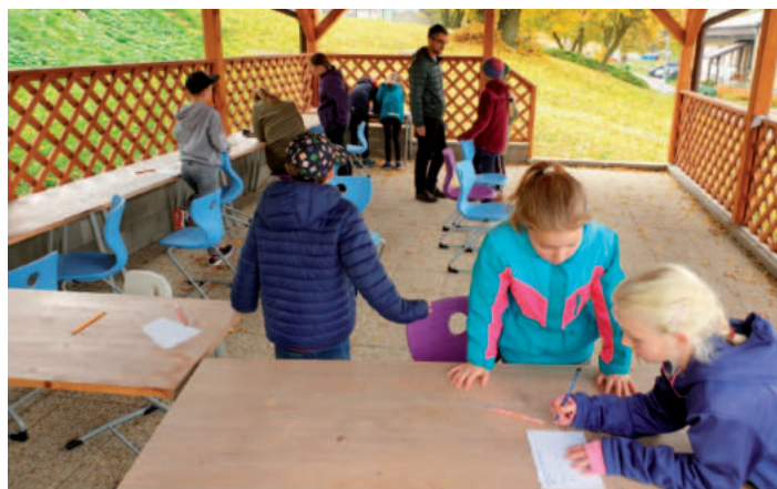
Projektový den pro žáky čtvrtých a pátých tříd na téma dílo a význam Jana Amose Komenského.