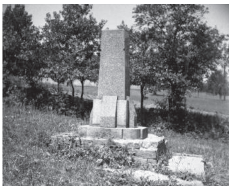
Válečný pomník v Proboštově.