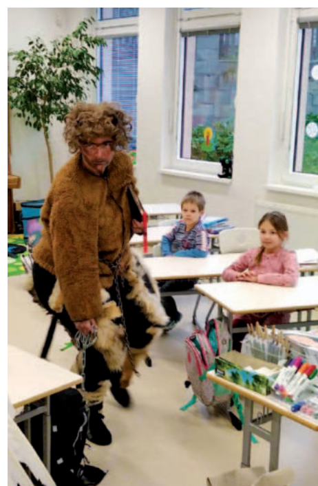
Do školy přišel čert...

Školu i školku navštívil Mikuláš s Andělem a Čertem. Básničky i písničky nás ochránily a stavy školáků se naštěstí nesnižovaly.