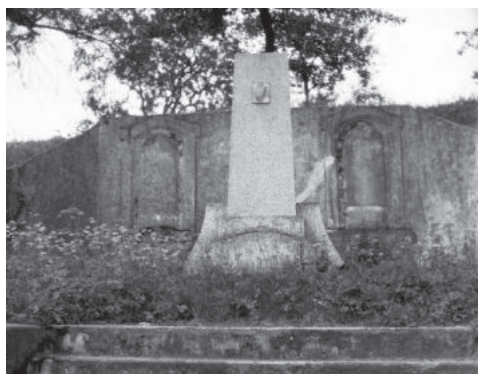
Válečný pomník v Břeží.

Spolek Malečovský rozhled se tak na Vás obrací s prosbou, zda byste finančním darem (možnost uzavření darovací smlouvy ke snížení základu daně z příjmu) nepřispěli k obnově pomníku. Pro tento účel spolek založil speciální účet č. 9661917060/5500 . Ke dni 15. 12. 2022 se hlavně díky paní Pilníkové podařilo mezi příznivci myšlenky renovace pomníku získat 15 500 Kč. Zdeněk Petr