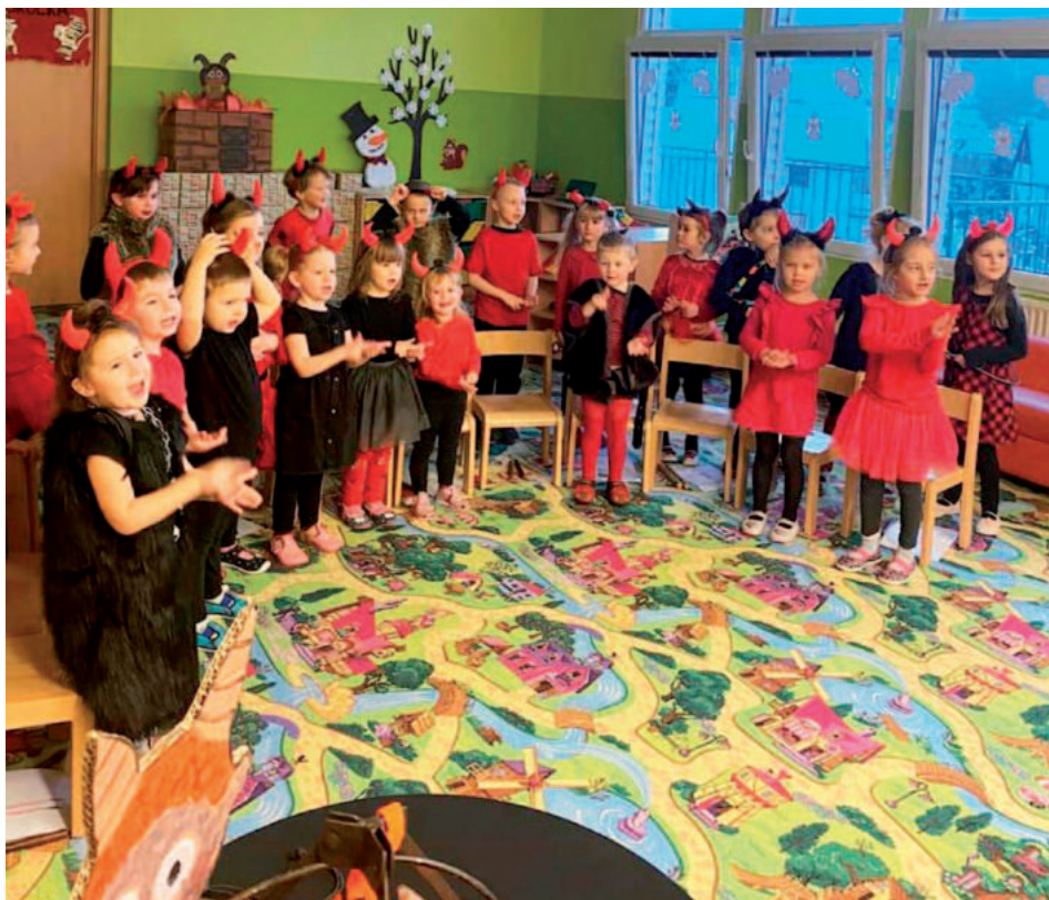
Vánoční besídka se samými čertíky.

Do akcí při příležitosti vánočních trhů, které pořádá naše obec, se zapojila ZŠ i MŠ přípravou tvořivých koutků. Dětem jsme nabídli spoustu výtvarných aktivit.