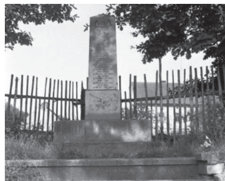
Válečný pomník v Rýdeči.