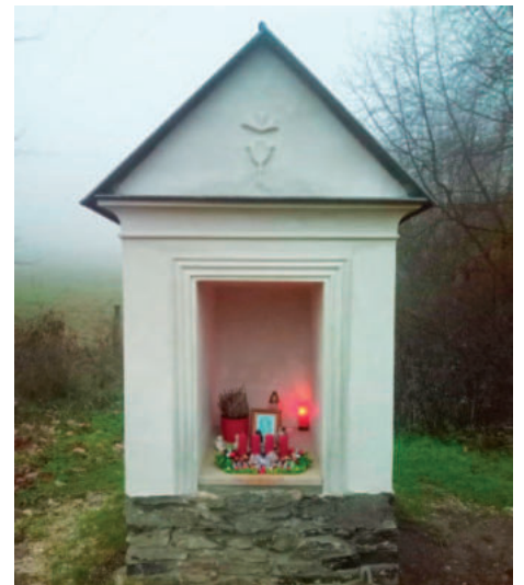
Kaplička u hřbitova v Čeřeništi.