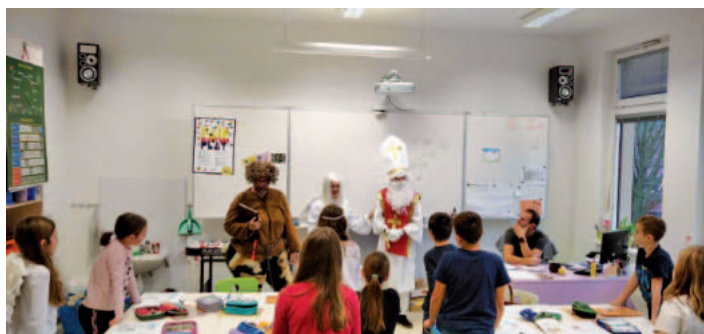
Mikuláš s čertem a andělem byli pro děti vítaným zpestřením dne.