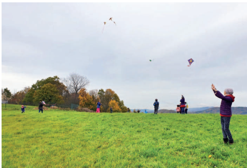
Drakiáda pro děti ze školní družiny.