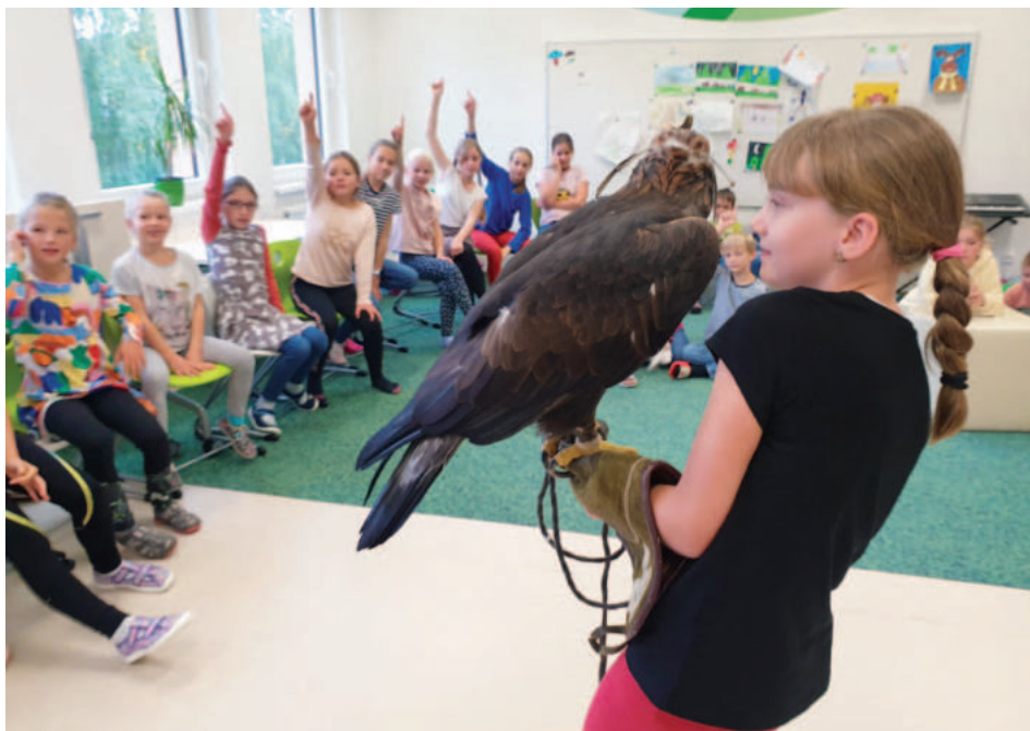
Přírodovědně zaměřený projektový den – tématem byl život různých druhů ptáků.

Nezahálela ani školní družina, ve které v průběhu celého roku žáci vytvářejí spoustu různých sezónních výtvarů. Povedená byla i drakiáda, při které se s drakem naběhali nejen děti, ale i rodiče.